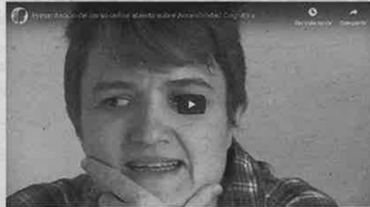
►► Página de internet a través de la que se accede al curso.

do 1.494 personas. 505 ya lo han acabado.